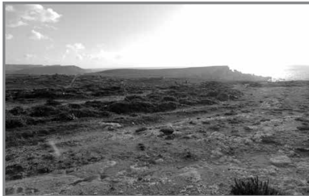
L-inħawi ta' Għajn Żnuber.

Fl-10.00am tat-13 ta' Mejju, seħħ attakk mill-ajru, fejn twaddbu bombi ta' splussiv qawwi f'għelieqi f'Għajn Żejtuna u l-Mizieb. Il-bombi splodew kollha, u għalkemm ma kkawżawx fatalitajiet, għamlu ħsara fil-linja tat-telefon, li kien hemm bejn il-Mellieħa u t-Telephone Exchange, li damet mit-8.00am sas-6.00pm. 21