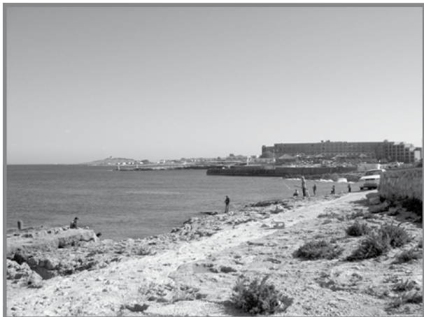
lż-żona bejn l-Armier u l-Marfa.

Sebat ijiem wara, fit-28 ta' Jannar, għall-ħabta tas-6.13am, żewġ ajruplani tal-ġlied tat-tip Messerschmitt Bf109Fs tfaċċaw fuq il-Mellieħa,