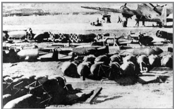
Bombi Germaniżi fuq ajrudrom fi Sqallija destinati għal Malta.

Fit-28 ta' April, ġie rrapportat li filgħodu waqgħet bomba fil-Kamp tal-Bajja tal-Mellieħa. 17 L-għada sar attakk ieħor, fejn erba' ajruplani tat-tip Cant Z.1007 eskortati minn erbġha u għoxrin Macchi C202 ġew irrappurtati li attakkaw il-Kamp tal-Bajja tal-Mellieħa mingħajr ma kkawżaw imwiet jew feruti. 18