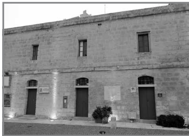
L-Għassa tal-Pulizija tal-Mellieħa.