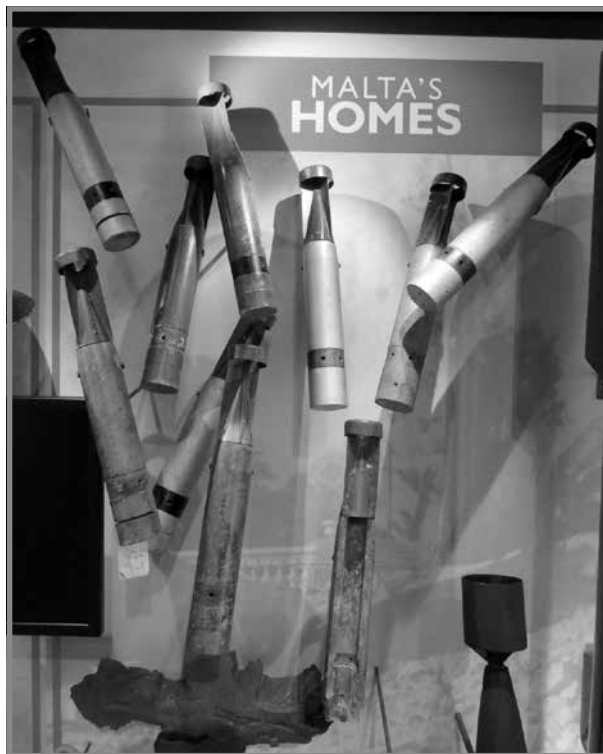
Bombi inċendjarji kif inhuma esebiti fil-Mużew Nazzjonali tal-Gwerra.