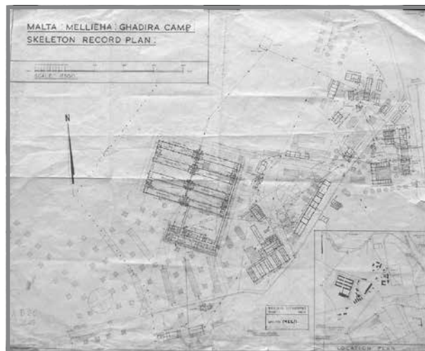
Pjanta tal-Kamp tal-Bajja tal-Mellieħa.

Mhux magħruf jekk dawn il-persuni ttieħdu l-Isptar Bugeja, jew Cauchi biss. 10