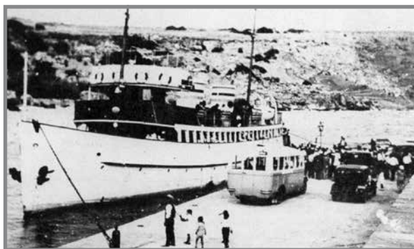
Il-vapur mv Royal Lady sorgut mal-Moll tal-Imgarr, Għawdex.

L-ewwel u t-tielet persuna tas-servizzi ttieħdu l-Isptar Navali tal-Imtarfa, mentri Xuereb intbagħat l-Isptar Bugeja għal aktar trattament. 7